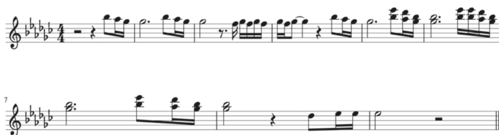
Abb. 4. Transkription (2:39)

Die letzte Phrase Kapoos „Fly daddy fly“ wird wiederum von der jungen Janine (Issy Burnham) aufgegriffen und in kurze Melodiephrasen verpackt, die in einen Gesangsteil der jungen Janine münden (Abb. 4):