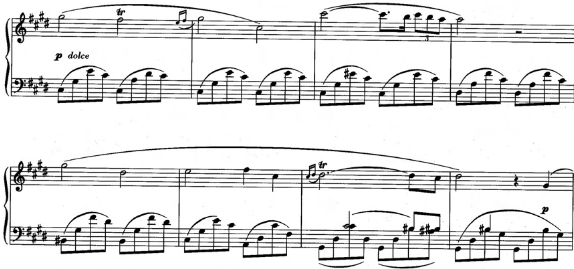
Figure 3: Frédéric Chopin, Nocturne C# minor, measures 5–12.

If we compare the two themes, several aspects stand out: first, the melodic lines of the long half notes, or dotted half notes, are very congruent. While Figures 1 and 2 are in C minor and Figure 3 is in C# minor, the long notes carrying the melody have the same functions in the harmonic context. In “Identität,” the melody progresses from the fifth of the underlying C minor chord down via the fourth (or 11) and to the second (or 9). The Nocturne, which features in the soundtrack to the film The Pianist , shows a very similar progression. Comparing the long notes of the recurring piano sample from “Identität” with bars 5 and 6 from the Nocturne, it becomes clear that the melodic progression is almost identical. But as Claudia Bullerjahn points out regarding the film music of The Pianist , the music sounds “not specifically Jewish, but is rather a music that uses the Western conventions of conveying suffering.” 89 Since various representations of suffering and sorrow have been accompanied by slowly and freely played piano passages in minor keys in different media, this motif from “Identität” may be associated with such narratives of grief in a similar way. Accordingly, the music does not only contribute to the negotiation of counter-narratives of the lyrics. Rather, the musical motifs seem to be able to provide intermedial parallels, for example to film and in this connection also to victim narratives, that play an important role in various media throughout (Jewish) history.