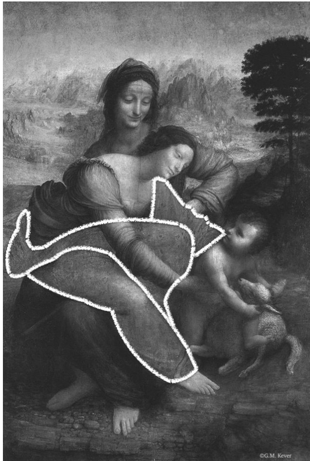
Abb. 2: Vexierbild ›Anna Selbdritt‹ von Leonardo da Vinci.

Die Analyse der Ida Bauer wird zum psychoanalytischen Therapiefall der ersten Stunde. Freuds Frage – was will das Weib? –, die sich durch die gesamte Psychoanalyse zieht, wurde von ihm in dieser Fallgeschichte das erste Mal zu beantworten versucht. Die Studie erscheint 1905 unter dem Titel »Bruchstück einer Hysterie-Analyse« und gilt als die am meisten kommentierte Fallgeschichte überhaupt. In ihr ereignet sich nicht nur die »Urszene der Psychoanalyse« (King), 4 sondern auch eine der folgenschwersten Weichenstellungen für die moderne Frauenrechtsbewegung. Gleichwohl Freud Doras (zweiten) Traum u. a. mit der Erklärung eines »Vorhofs« (Vestibulum vaginae)