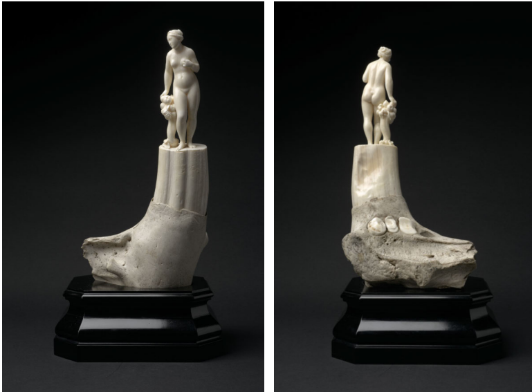
Abbildung 4 und 5: Front- und Rückansicht: Abundantia oder Pomona , Leonhard Kern, vor 1647, Kunstammer Wien