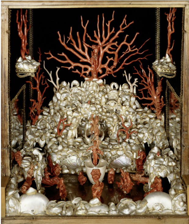
Abbildung 1: Korallenkabinett, Kabinettschrank mit Korallen, 2. Hälfte 16. Jahrhundert, Schloss Ambras Innsbruck

© KHM-Museumsverband, Inv.-Nr. PA 961, https://www.khm.at/objekt/db/detail/504897/ (zugegriffen am 12.07.2025)