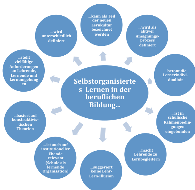
Abbildung 2: Merkmale von selbstorganisiertem Lernen in der beruflichen Bildung

Zusammenfassend lassen sich die Merkmale und Kerngedanken von selbstorganisiertem Lernen mithilfe der folgenden Grafik darstellen: