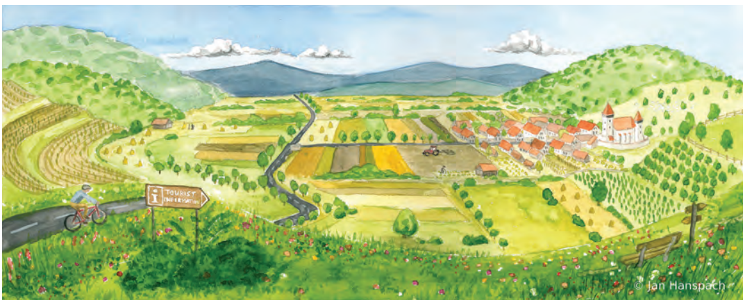
Balance brings beauty: Southern Transylvania in 2043.

Finanziell gesehen sind nur Wenige wirklich reich, aber kaum jemand lebt in Armut. Die Menschen haben die letzte Dürre gut überstanden und sind den Preisschwankungen der landwirtschaftlichen Erzeugnisse bei weitem nicht so stark ausgesetzt wie viele Landwirte im Westen Europas. Die Spannungen zwischen den Volksgruppen sind fast verschwunden – dank der vielen ausländischen Besucher, aber auch dank der zunehmenden Offenheit gegenüber anderen Kulturen. Der Dienstleistungssektor wächst kräftig und ergänzt den starken Produktionssektor der Land- und Forstwirtschaft. Obwohl viele junge Leute die Region kurzzeitig verlassen, kehren viele wieder zurück, da sie die Schönheit der heimatlichen Gegend und die hiesige Lebensweise immer noch sehr schätzen.