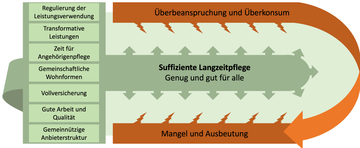
Figure 1: Suffizientes Pflege und Ansatzpunkte im deutschen Pflegesystem

Gruppen – Menschen mit Pflegebedarf, pflegende Angehörige und professionelle Pflegekräfte – ein. Ziel der vorgestellten Maßnahme ist eine sozial-ökologisch-resiliente und im Sinne von "genug" gestaltete, gute Pflege.