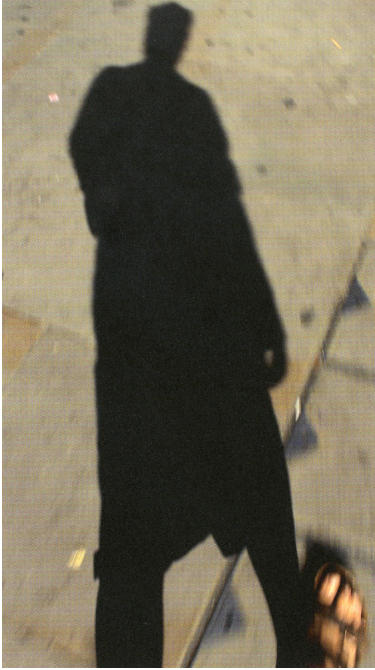
Abb. 4: „[...] diese Beine, wem seine, meine? Ja. Ich bin zu faul, Beobachtungen zu machen, sehe auf meine Beine herab und marschiere weiter.“ (Walsers, „Der Park“) Mark Wallinger: Shadow Walker , 2011, Video, 3 Min. 39 Sek. © Courtesy Hauser & Wirth.

Mark Wallingers Beitrag zur Ausstellungsreihe A Little Ramble. In the Spirit of Robert Walser des Galeristen Donald Young (Chicago, 2011/2012) kombinierte sein Video Shadow Walker sprechenderweise nicht mit einem der zahlreichen Walser-Texte, die bereits im Titel mit dem Hinweis auf eine Kultur des Gehens und Spazierens (Pfeifer und Sorg) markiert sind ( A Little Ramble 62–69). Er setzte seinen Film in Beziehung zu Walsers Prosaskizze „Der Park“ (38–41). Dabei zeigt dieses Video nichts anderes als einen sich auf einem städtischen Pflaster in Gehbewegungen abzeichnenden Schatten. Die Kulturgeschichte des Schattens ist eng mit der Frage nach einem ‚Ursprung‘ der Bildenden Künste verknüpft (Stoichita 11–19). Nach Plinius’ Naturalis historia liegen die Anfänge der Malerei und Skulptur im zeigenden und zeichnenden Gestus einer Liebenden, der Tochter des Töpfers Dibutades, begründet, die zur Erinnerung an den scheidenden Geliebten den Umriss seines Schattens an eine Wand zeichnete. Die zweidimensionale Fixierung wird durch die Töpferkunst des Vaters in ein dreidimensionales Relief übertragen und gebrannt.