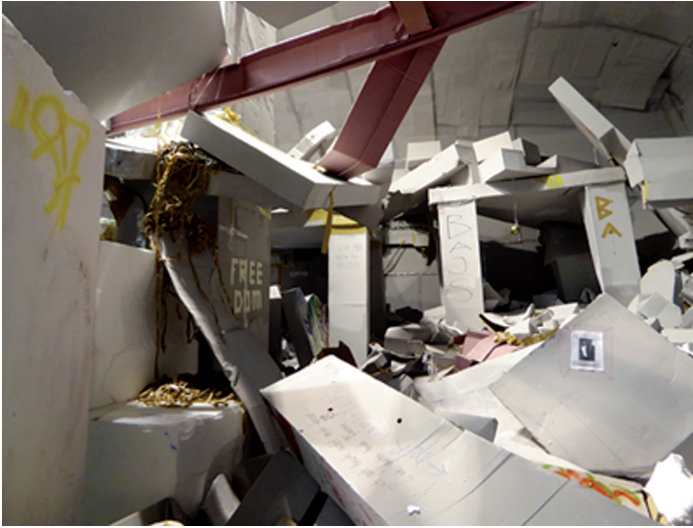
Abb. 3: Thomas Hirschhorns Ruinen-Installation Never Give Up The Spot im Museum Villa Stuck, München, 2018.