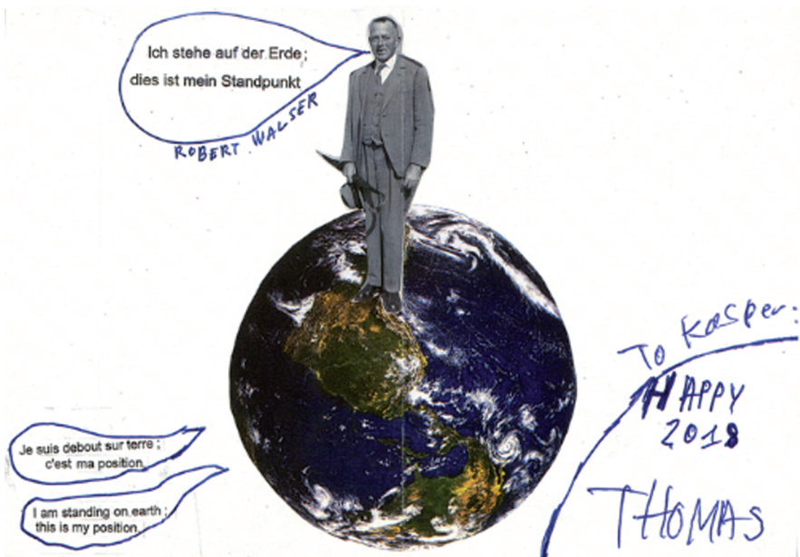
Abb. 1: Thomas Hirschhorn: Ich stehe auf der Erde; dies ist mein Standpunkt. Collage, Geschenk an den Kurator Kasper König zum Jahreswechsel 2017/2018, Sammlung Kasper König.

In diesem, dem Kurator Kasper König zugeeigneten Walser-Portrait kombiniert Thomas Hirschhorn die jeder Ästhetik der Collage eigene Zufälligkeit und erkennbare Brüchigkeit mit zwei eindeutigen wie unwiderlegbaren Sätzen: „Ich stehe auf der Erde: dies ist mein Standpunkt.“ (Walser, Kleine Dichtungen 10) 1 Sie sind Robert Walsers Miniatur „Brief eines Dichters an einen Herrn“ entnommen und lassen in ihrer komischen Gegensätzlichkeit und tragischen Brechung sogleich an Haltung und Dimensionierung von Le Petit Prince in Antoine de Saint-Exupérys Illustration