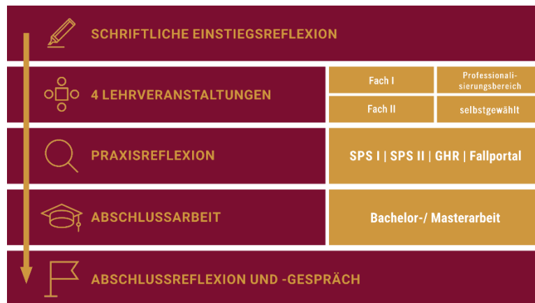
Abb. 1: Bestandteile im ePortfolio