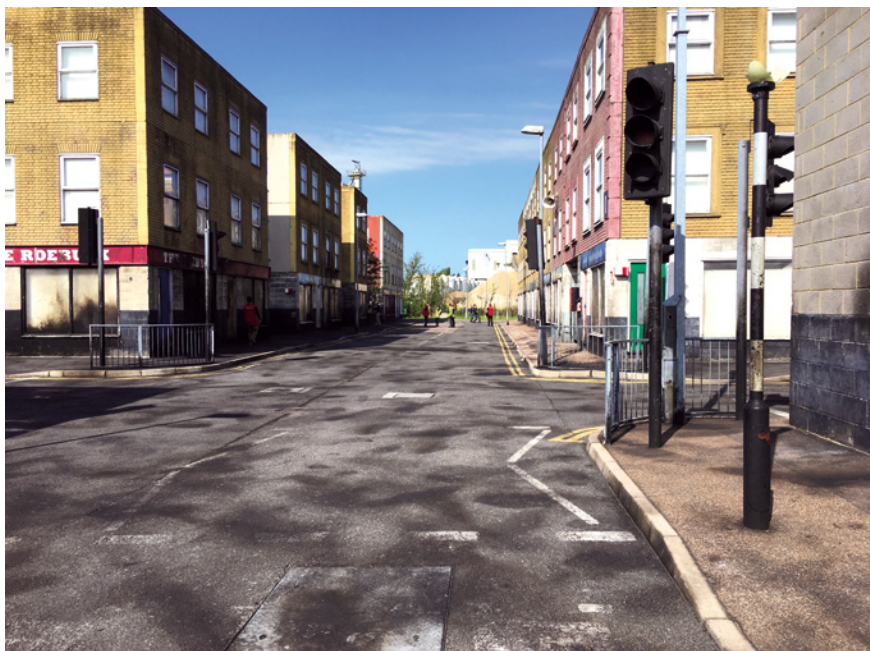
Abb. 13: Hauptstraße der Stadt des englischen MPSTC, Gravesend

Auseinandersetzungen (abgebrannte Autos, herumliegende Kautschuksteine (Kretschmann 2022), Brandspuren, Bestandteile zum Barrikadenbau) verdeutlichen, dass politische Differenzen bestehen: Sie zeigen an, dass hier nicht alle die gleichen Positionen vertreten, sondern dass Konflikte über Fragen des gesellschaftlichen Zusammenlebens vorkommen.