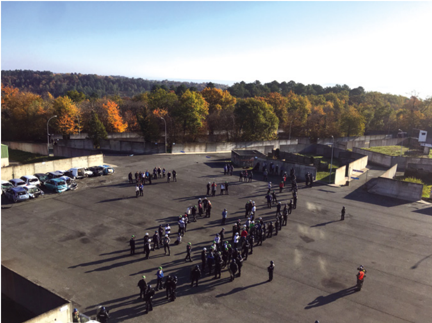
Abb. 6: Ein kleiner Ausschnitt des Schulungszentrums der Gendarmerie nationale (CNEFG), Saint-Astier

einige städtische Charakteristika aufweisenden Militärgelände im Londoner Stadtteil Feltham, später folgte dann der Umzug in eine verlassene Gasanlage im Stadtteil Greenwich. 1985 wurde erstmals eine eigene Fläche mit Häusern und Straßen im Londoner Hounslow Heath bebaut.