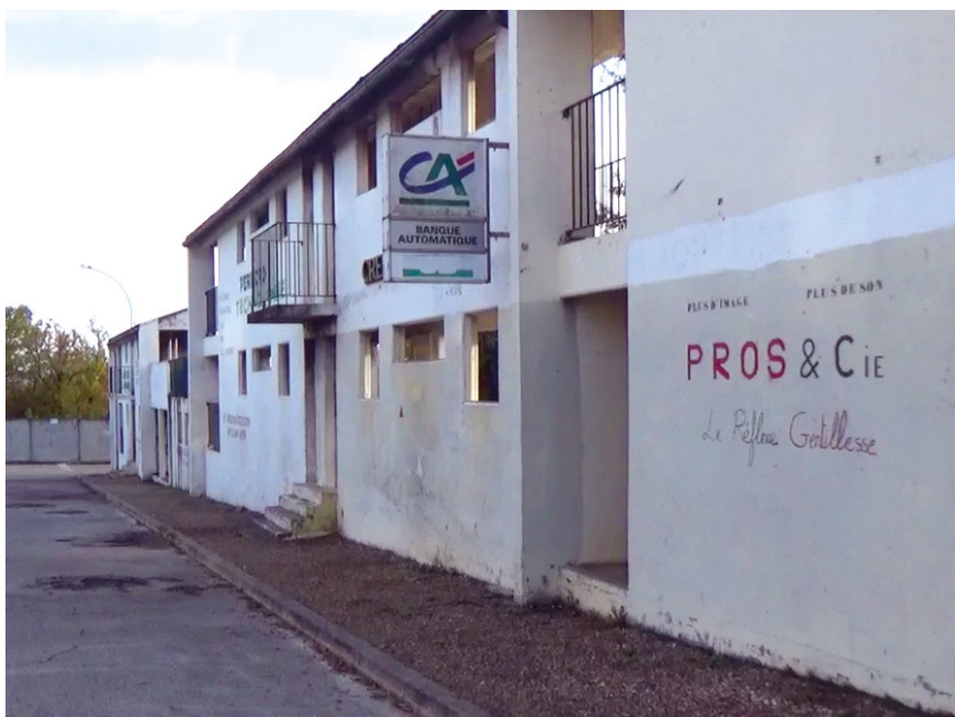
Abb. 11: Hauptstraße von pôle 1 im französischen CNEFG, Saint-Astier

eines Rathauses und eines Kulturzentrums. Deutlich wird dies anhand der Aufschrift ›Mairie‹ [›Rathaus‹] und ›Centre culturel‹ [›Kulturzentrum‹] einschließlich der Öffnungszeiten (›ouverture bureaux, 8h30 à 12h; 13h à 18h‹ [›Büroöffnungszeiten 8h30 bis 12h; 13h bis 18h‹]) auf den beiden nebeneinanderliegenden Gebäuden. In der etwas längeren Parallelstraße sind Geschäfte des täglichen Bedarfs dargestellt: Bunte Aufschriften auf den Häusern stellen in einigen Teilen Ladenfronten dar. Mitten in dieser Einkaufsstraße ist auf der gegenüberliegenden Seite der Geschäfte ein Gefängnis angesiedelt, in dem sich Einsätze in Strafvollzugsanstalten simulieren lassen. 3