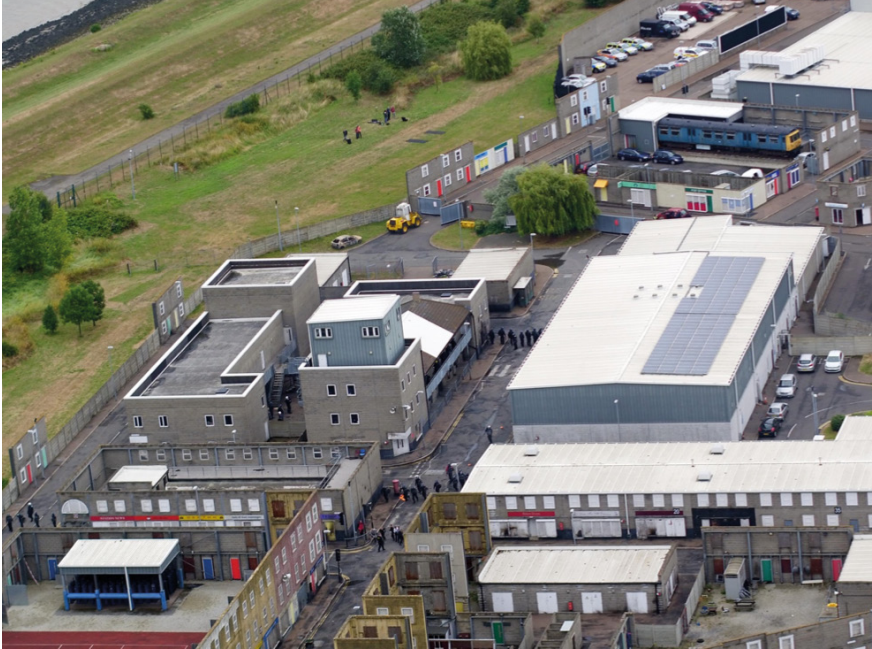
Abb. 5: Ausschnitt des Schulungszentrums der Londoner Polizeien, Gravesend 2

gebaute und seitdem von wechselnden privaten Betreibern verwaltete MPSTC wurde im Jahr 2003 eröffnet, um neben dem Schusswaffen-Training im städtischen Gelände public order -Training für einige Polizeien der Londoner Region bereitzustellen (konkret für die Metropolitan Police, die London City Police sowie die British Transport Police).