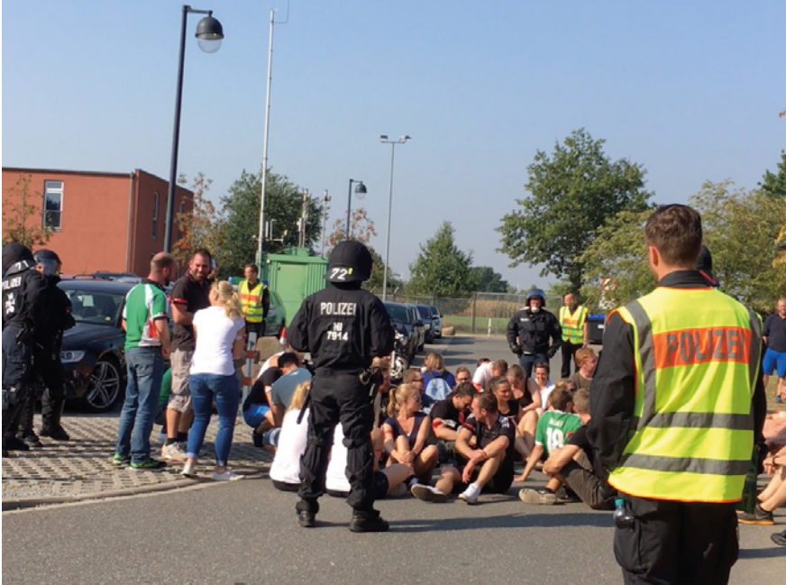
Abb. 37: Sitzblockade bei der Polizei Niedersachsen mit begleitenden Trainer:innen, Lüchow

Sie trägt dazu bei, dass diese sich (mit Ausnahme von Frankreich) in einer für die Polizei ungewohnt ungezwungenen Weise geben können, wie immer wieder betont wird.