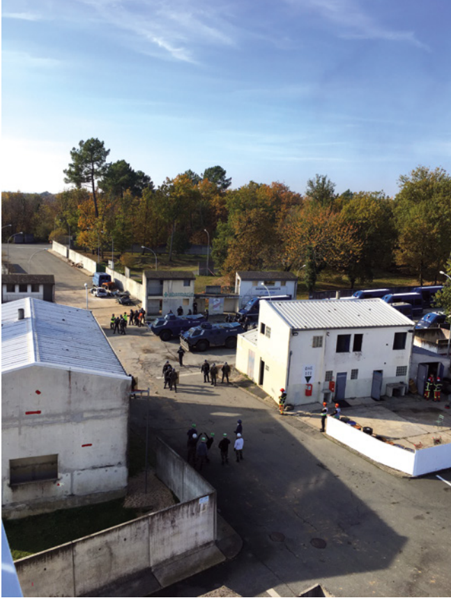
Abb. 15: Teil von pôle 1 im französischen CNEFG, Saint-Astier

(Gestring/Ruhne/Wehrheim 2014) – auch ein Ort, an dem aufgrund seiner symbolischen Bedeutung (etwa, weil hier zentrale Plätze, der Regierungssitz, die Zentralbank etc. angesiedelt sind) traditionell Proteste stattfinden. Die älteste artifizielle Stadt Europas zu polizeilichen Simulationszwecken für protest policing stellt mithin die demokratiethoretisch idealtypische Umgebung für Protest dar: die mehr oder weniger im Zentrum gelegene Innenstadt als Herz des politischen Ausdrucks.