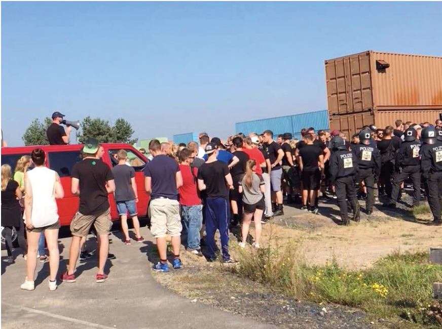
Abb. 25: Zwischenkundgebung eines Demonstrationzugs in ›Barbaradorf, Militärübungsplatz bei Munster