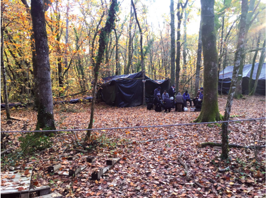
Abb. 21: ZAD der französischen Gendarmerie ( pôle 4 ), Saint-Astier

Hochhäuser bzw. kleine Mehrfamilienhäuser schaffen wolle (IFE7, Z. 510 und 512). Tatsächlich erinnern die Häuser an kleine Wohnblöcke, wobei die geringe Höhe im Vergleich zu einem Hochhaus in der banlieue wohl den begrenzten budgetären Möglichkeiten der Gendarmerie geschuldet sein dürfte. Die départements et régions d'outre-mer sind städtebaulich teilweise im Rechteckraster angelegt, so dass gerade, rasterförmige, sich überkreuzende Straßen das städtische Bild ausmachen. 21 Insofern erscheint die Darstellung in Saint-Astier in dieser Hinsicht passförmig. Unklar bleibt für diese Regionen jedoch, ob für die Überseeterritorien tatsächlich jeder beliebige Ort innerhalb der Stadt dargestellt werden soll, was darauf hinweisen würde, dass sich Erwartungen von ›franchissements‹ auf die gesamte Bevölkerung beziehen, oder ob nur bestimmte ›Problemviertel‹ in der Stadt gemeint sind. Einer Bevölkerung gegenüberzutreten, die von der Polizei nicht mehr mit herkömmlichen bürgerpolizeilichen Maßnahmen bedacht wird, sondern der gegenüber hauptsächlich im Modus der Aufstandsbekämpfung operiert