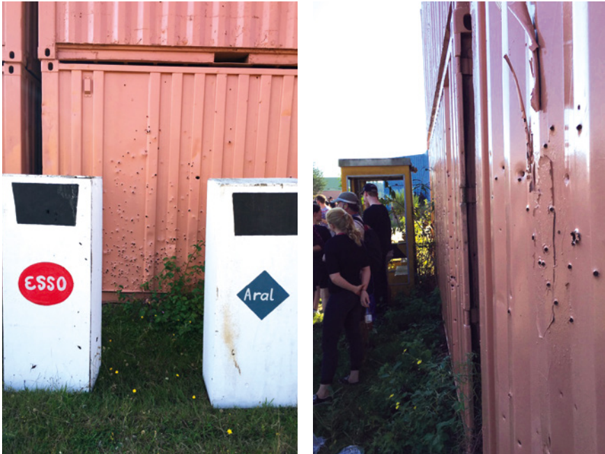
Abb. 18: Tankstelle und Gebäude mit Einschusslöchern, Militärübungsplatz bei Muster

Dieser Umstand erweist sich als besonders relevant, berücksichtigt man, dass für Polizeien, die über keine eigenen Trainingsanlagen verfügen, Truppenübungsplätze oft die einzige Möglichkeit darstellen, Simulationen mit höheren Eskalationsgraden durchzuführen. Für die Polizei Niedersachsen etwa bilden die Übungen auf Truppenübungsplätzen derzeit die einzigen Terrains, auf denen sie Autos anzünden und den Bewurf von Polizist:innen mit halbvollen 0,5l- Plastikflaschen anstatt mit Tennisbällen üben können (Tennisbälle werden in Lüchow verwendet). Durchgeführt werden derar-