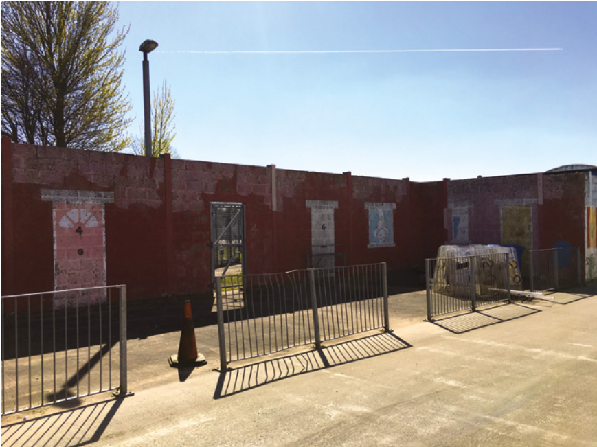
Abb. 16: Eine der zentralen Straßen des nordirischen Public Order Tactical Village nahe Belfast

drei engere, nur zu Fuß begehbare Wege. Zudem sind rechteckige ›Räume‹ vorhanden, die sich aus einigen der Mauern konstituieren, die als ›Häuser‹ die Straßen begrenzen. Sie sind jeweils durch eine Metalltür zugänglich. Blickt man durch diese hindurch, werden grüne, ungepflegte Grasflächen auf trockenem, von Kies durchzogenem Boden erkennbar. In der Mitte des Trainingsgeländes ist ein kleiner Platz angelegt, auf dem sich eine entglaste Telefonzelle befindet. Die Stadt des PSNI ist mithin in erheblich geringerem Maße ausdifferenziert als die Städte der anderen Länder. Ob nun eine Groß-, Mittel- oder Kleinstadt repräsentiert wird, lässt sich aus dieser besonders groben Darstellung nicht ableiten, auch wenn Straßennamen wie ›Crimson Square‹, ›Grey Street‹, ›White Road‹, ›Ivory Street‹ und die niedrigen Hausnummern (7 bis 9) eher den Eindruck einer kleineren Agglomeration vermitteln. Ähnlich wie die Stadt der Londoner Polizeien könnte die Übungsstadt aufgrund der auch in Nordirland üblichen niedrigen städtischen Bebauung sowohl ein Ausschnitt einer größeren Stadt oder einer Mittelstadt, aber ebenso einer Kleinstadt sein.