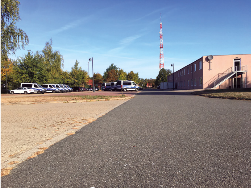
Abb. 14: Fahrweg auf der Anlage der Polizei Niedersachsen, Lüchow

Peripherie von Ballungsräumen« (Jessen 2000: 104 f.): In verstärktem Maße werden »Zwischenstädte« (Sieverts 1995) gebaut, die nicht unbedingt ein klar erkennbares Zentrum haben (ebd.: 15). Sie weisen netzwerkartige Funktionszusammenhänge bei geringerer Siedlungsdichte auf; all dies bei nicht oder kaum vorhandener ÖPNV-Struktur und ausgelegt auf den Autoverkehr.