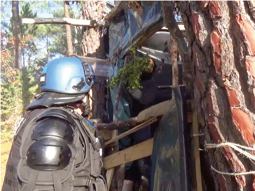
Abb. 29: Kommunikation der Gendarmerie mit einem friedlichen Bewohner der ZAD, Saint-Astier

eine Tendenz besteht, »unterschiedslos auf jeden einzuschlagen, der ihnen in den Weg kommt und sich als Ziel eignet« (ebd.).