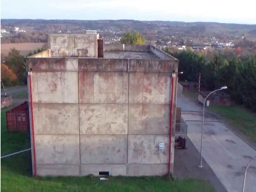
Abb. 20: Banlieue und outré-mer der französischen Gendarmerie ( pôle 2 ), Saint-Astier

W. Boulanger, Z. 293–295). Die Straße endet knapp hinter dem zweiten Haus in einem Wald, wo sie in einen Waldweg übergeht, während die Häuser an der Front von einem Bürgersteig und an den Seiten von einer grünen, hügeligen Graslandschaft, die als Grünfläche lesbar ist, umrahmt sind. Rechts, links und hinter den Häusern verläuft im jeweils rechten Winkel ein geteertes Gehweg, der von Straßenlaternen gesäumt ist. Angestrebt wurde hier, einen Ort mit hoher Dichte wie in den banlieues zu bauen, die zu den Rändern hin abnimmt, wie dies als typisch für die urbanen Überseestrukturen beschrieben wird: »Et donc en fait, on se rend compte, on .. on voulait recréer aussi le centre urbain type euh centre urbain africain où on a une grande densité urbaine au centre, puis plus on s'éloigne plus ça devient lâche, et .. des routes en terre, enfin plus larges, moins matérialisées quoi. Comme vous pouvez le remarquer, y a certaines rues qui deviennent moins matérialisées.« [»Und dann haben wir realisiert .. wir wollten außerdem ein Stadtzentrum wie ein ähm afrikanisches Stadtzentrum erschaffen, wo wir eine hohe städtische Dichte im Zentrum haben, die dann, je weiter man sich vom Zentrum entfernt, umso mehr abnimmt, und .. unbefestigte Straßen, die breiter sind,