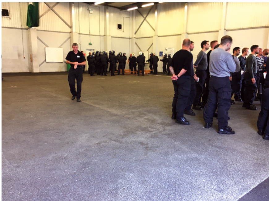
Abb. 34: Theoretische Einheiten zwischen den praktischen Übungen im englischen MPSTC, Gravesend

konkreten Individuen zweifelsfrei zurechnen können, denn im Fall einer Festnahme wird es als entscheidend angesehen, dass ausreichend Beweise für eine Verurteilung vorliegen. Der entsprechenden Kurzsimulation geht ein Input seitens eines Trainer:in voraus, in dem Techniken des Erinnerns relevanter, die Täter:innen identifizierender Merkmale gelehrt werden. Jeweils gefolgt von einem debriefing wird die Situation sodann mehrmals durchgespielt.