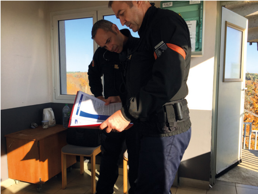
Abb. 23: Französische Gendarmes mit Skript bei einer Simulation im tour direx ( pôle 4 ), Saint-Astier

voilà, on fait quitter la place [...]« [Ich will sagen: Wir spielen die Situation nicht, wir spielen die Situation nicht, aber wir wissen, dass es fünf Mitarbeiter im Gewerkschaftshaus gibt, es war keine Zeit ... sie wurden herausgeholt, wir räumen diesen Ort [...].] (VideoF2, Trainer J. Girard).