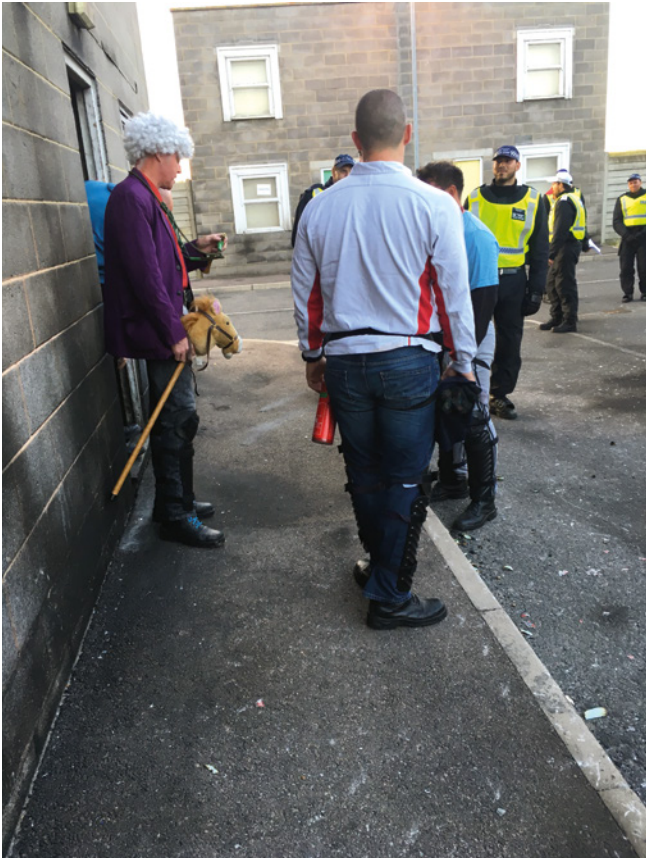
Abb. 28: Crowdleader mit Steckenpferd im englischen MPSTC, Gravesend