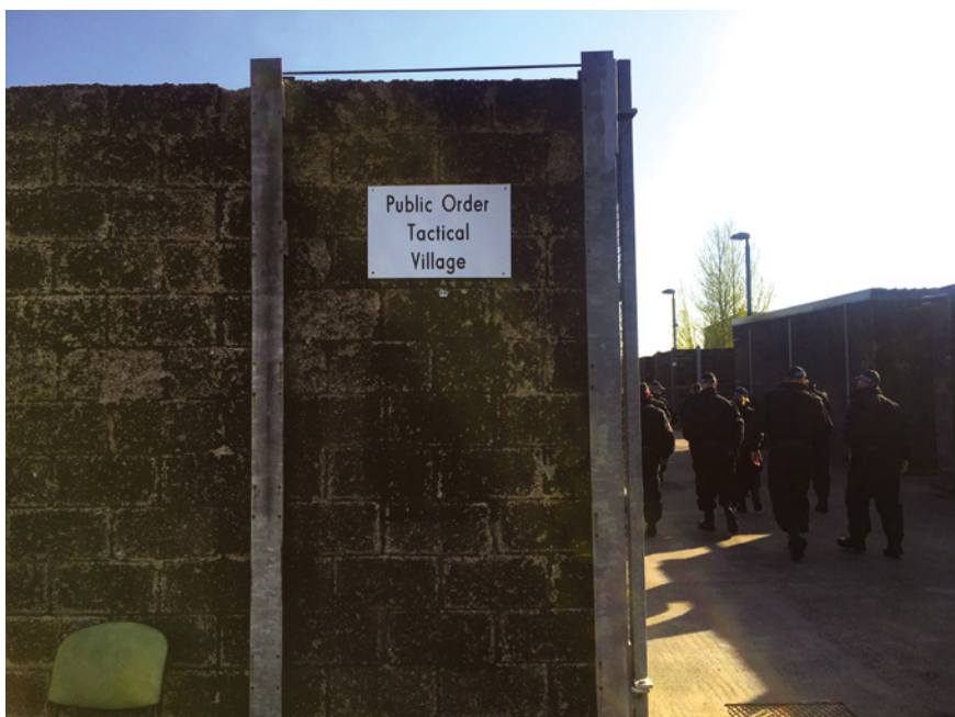
Abb. 7: Trainingsstadt der Polizei Nordirland nahe Belfast

Daneben veranstaltet es transnationale Trainings und bildet – vor Ort und in Fachmissionen im Ausland – Polizist:innen anderer Länder aus. Auf einer Fläche von 140 Hektar können bis zu 900 Menschen trainiert werden, auch wenn es selten zu einer vollen Auslastung kommt. Wie in England gibt es auf dem Gelände neben Verwaltungs-, Wohn- und Schulungsräumen ein abgetrenntes Areal für das praktische Training von protest policing . Es weist gleich drei unterschiedliche ›städtische‹ Komplexe sowie ein mit Hütten ›besiedeltes‹ rurales Gebiet auf.