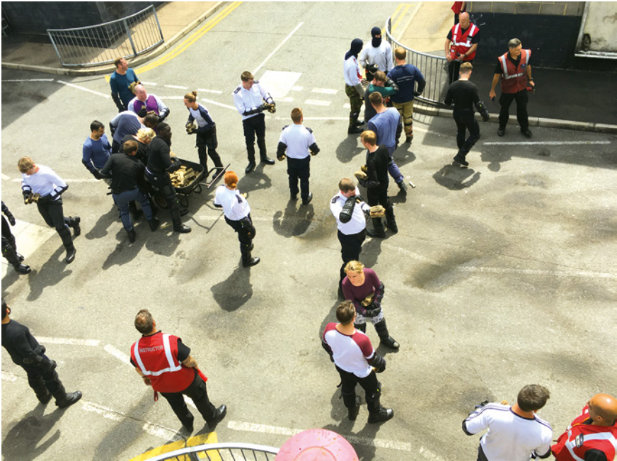
Abb. 26: Teil einer crowd im englischen Schulungszentrum mit crowdleader , Gravesend

die Möglichkeit, spontan Anpassungen vorzunehmen. Dies wird etwa als erforderlich erachtet, »wenn zeitlich irgendwas nicht passt, also wenn Laufwege irgendwie zu lang sind oder ähm ja sich verschiedene Gruppen, die sich eigentlich treffen sollen nicht treffen, nicht zusammen kommen oder in die falsche Richtung laufen oder so was. Das kann natürlich in der Realität so passieren, aber das will man ja ... man hat ja in der Übung eine begrenzte Übungszeit, dann kann es sein, dass solche Situationen, die zu polizeilichen Einsatzszenarien führen ähm, ja, ein bisschen, ich sach mal, gelenkt werden, 'ne. Also dass diese einzelnen Führer von diesen Störerguppen, also die dann zum Beispiel links- oder rechtsextreme Demonstranten darstellen, dass die dann die Anweisung kriegen, in eine bestimmte Richtung zu laufen, dass die dann aufeinander treffen, um dann halt 'ne polizeiliche Trennung von verschiedenen Gruppen dann halt üben zu können. Also anderenfalls könnte es ja sein, dass alle dann warten und nichts machen und dann würde die Zeit verstreichen und da wäre der Aufwand das auch nicht wert, deswegen werden solche Situationen dann manchmal ausgelöst aktiv.« (IDE7, Z. 284–294)