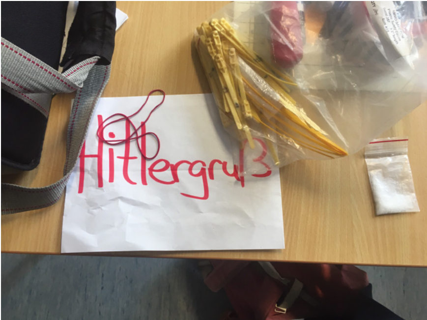
Abb. 30: Zum Training verwendeter Hitlergruß der Polizei Niedersachsen, Lüchow

etwa darin, im Rahmen einer Simulation mit rechten Akteur:innen den Hitlergruß nicht tatsächlich zu zeigen. Als geschauspielerte Handlung ist der Gruß zwar nicht strafbar. Da der spielerische Charakter der Simulation aber verkannt werden könnte, soll einer »schlechten Außenwirkung« (IDG11, Z. 409) vorgebeugt werden, indem das Wort auf einen Zettel geschrieben wird, um ihn im entsprechenden Moment hochzuhalten.