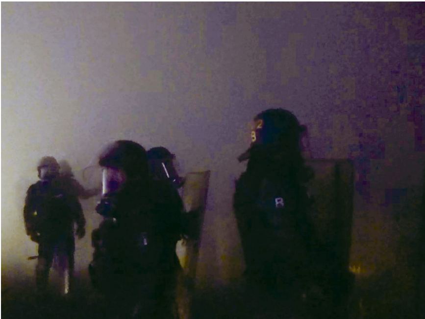
Abb. 2: Französische Gendarmes mit Gasmasken bei einer Nachtübung im Tränengas, Saint-Astier

Beißende Rauchschwaden vernebeln mir die Sicht und ich muss meine Gasmasken aufsetzen. Alles, was vorher in Bewegung war, kommt nun zum Stillstand. Die Steine- und Molotow-Cocktailwerfenden haben die Flucht ergriffen. Die Zeit scheint plötzlich verlangsamt; die Geräusche gedämpft. Häuserfassaden und Gestalten verschwinden unter dem Nebel ganz oder sind gerade noch schemenhaft zu erkennen. Erzwungene Auszeit. Ich bemühe mich, nicht die Orientierung zu verlieren oder von Nachzügler:innen überannt zu werden. Als die Sicht langsam aufklart, öffnet sich die Szenerie: Die mit Helmen, Protektoren, Langschildern, Schlagstöcken und Granatwerfern ausgerüsteten Polizist:innen kommen wieder in Bewegung. Mit lauten und hektischen Rufen gruppieren sie sich um, indem sie in die nächste