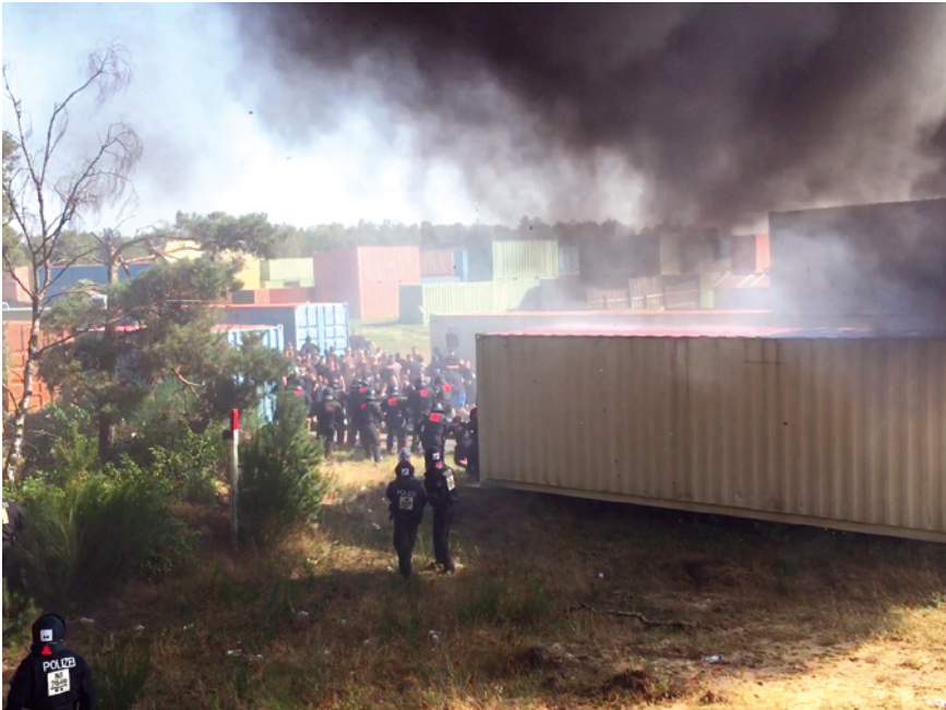
Abb. 17: Militärübungsplatz des deutschen Militärs bei Munster in Niedersächsischer und Hamburgischer Nutzung

diese ein genauerer Blick gerichtet werden soll. Ein Exkurs ist hier nötig: Die polizeilichen Staatsgewalten aller von mir untersuchter Länder trainieren von Zeit zu Zeit auf externen Trainingsgeländen. Hierzu zählen neben verlassenem Gebäuden (etwa Fabriken, ehemaligen Industriestandorten) oder realen Städten 12 auch Trainingsgelände des Militärs mit eigens angelegter städtischer Struktur.