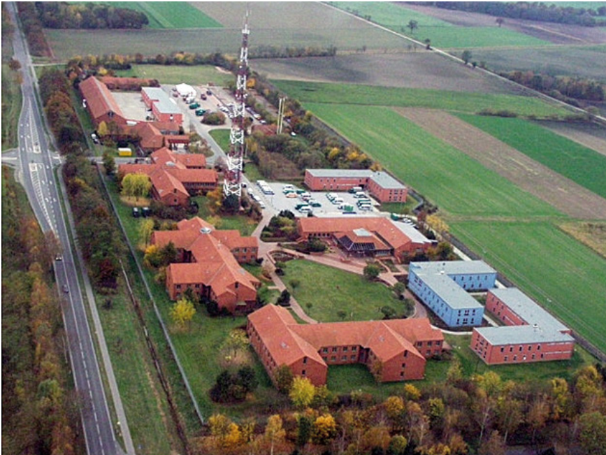
Abb. 8: Polizeiliegenschaft Lüchow 5

Viertens untersuchte ich Simulationstrainings der deutschen Bereitschaftspolizeien am Beispiel der Polizei Niedersachsen am Fortbildungsstandort Lüchow im wendländischen Niedersachsen. Die Liegenschaften der Bereitschaftspolizeien in Niedersachsen verfügen nicht über eigens errichtete, städtische Strukturen für public order -Trainings, denn die Fortbildungen werden nicht im eigentlichen Sinne in Schulungszentren durchgeführt. 6 In Lüchow besteht deshalb keine Trennung zwischen den Räumen des Trainings und jenen Bereichen, in denen die Verwaltungs-, Übernachtungs-