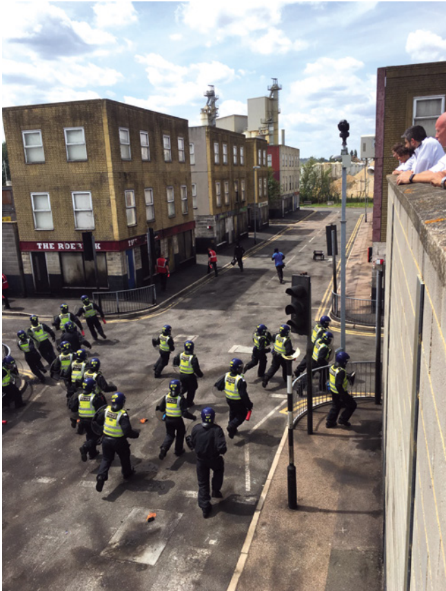
Abb. 33: Dynamisches Training im englischen MPSTC, Gravesend