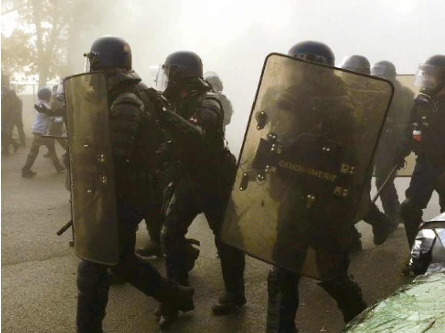
Abb. 35: Gewaltsame Auseinandersetzung mit Protestierenden in pôle 1 , Saint-Astier

es nun, die sich in den Trainings angesichts der Simulation von worst cases potenziert: Die Trainings gelten als anspruchsvoll, weil der schlimmste Fall trainiert wird. Gefahren- und ungewissheitsbasierte Sinngebungen, wie sie das protest policing in aller Regel umgeben – man kann auch an dieser Stelle von ›Gefahrengeschichten‹ sprechen (vgl. so auch Kapitel 4) –, finden sich deshalb in intensivierter Form im Kontext der Trainings wieder.