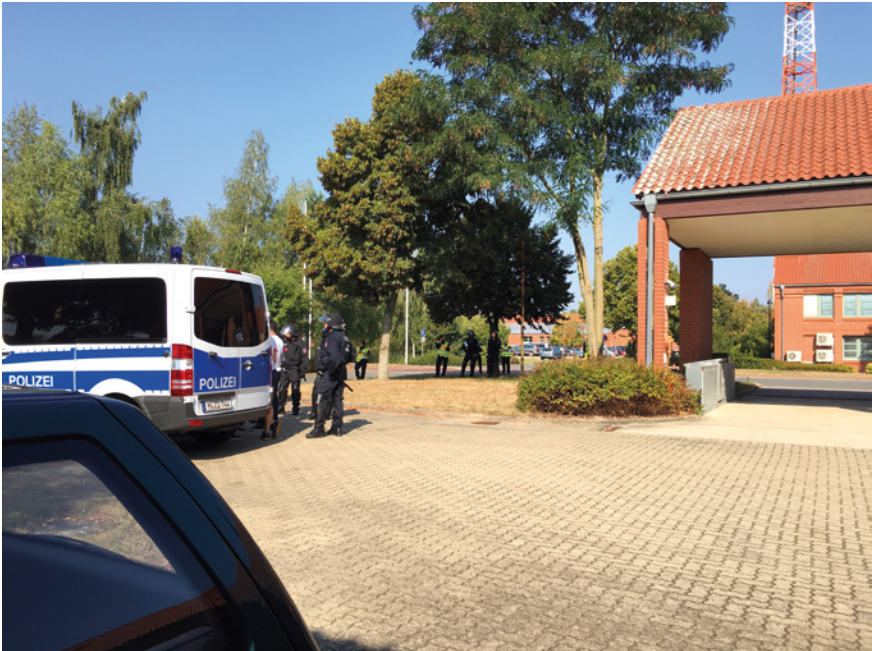
Abb. 12: Zum Training verwendete Polizeiliegenschaft der Polizei Niedersachsen, Lüchow

etwas abseits; es grenzt an die Grünfläche an. Damit besteht in England wie in Frankreich (vom Gefängnis einmal abgesehen) eine Trennung zwischen dem kommerziellen und dem administrativen Teil der Stadt; eventuell ließe sich bei Letzteren von einem – freilich in Miniaturgröße angelegten – Regierungs- oder Verwaltungsviertel sprechen.