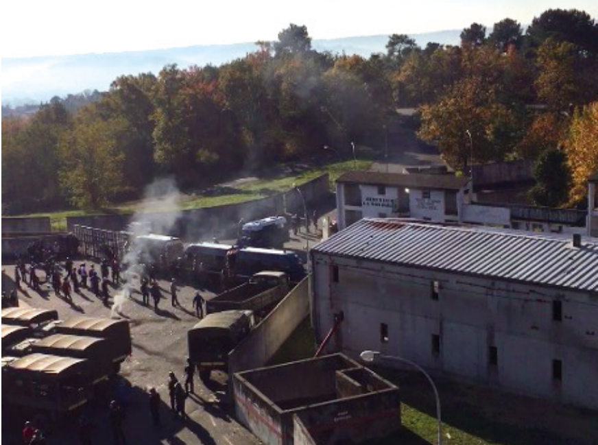
Abb. 10: Ausschnitt aus pôle 1 des französischen CNEFG, Saint-Astier

die Lage anspannt, taktisch in den Straßenmündungen postieren. Das ist unglaublich, ist mein erster Gedanke. Das ist alles nicht echt. Und trotzdem so aufwändig gestaltet. Was machen die Polizeien mit diesen Räumen bloß? Und was machen die Räume mit den Polizeien?