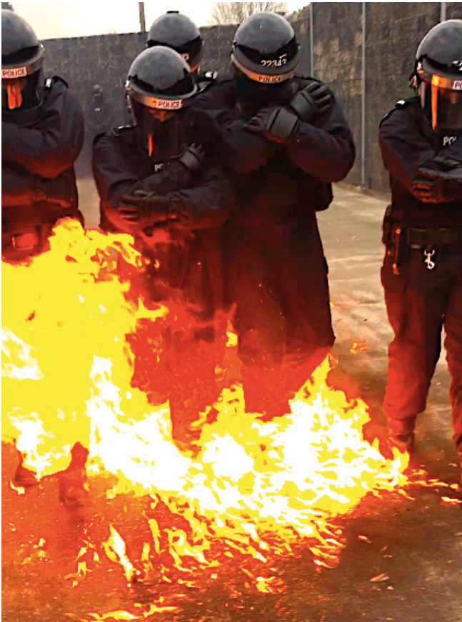
Abb. 4: Die Autorin (2. v. links) beim Molotov-Cocktail-Training, Nordirland bei Belfast

Als ich die Polizeiuniform mit Hilfe einer Trainerin angezogen habe – sie besteht aus zahlreichen, übereinander zu schichtenden Einzelteilen, die ich als Ungeübte kaum allein zuordnen könnte, geschweige denn anlegen –, sind die Fortzubildenden schon mitten im Geschehen. Es knallt und riecht nach Rauch, Rufe sind zu hören. Noch bevor ich erfassen kann, was hier vor sich geht – die Sicht wird durch eine Mauer verdeckt – werde ich aufgefordert, mich in eine Dreiergruppe einzugliedern. Ich werde angewiesen, die