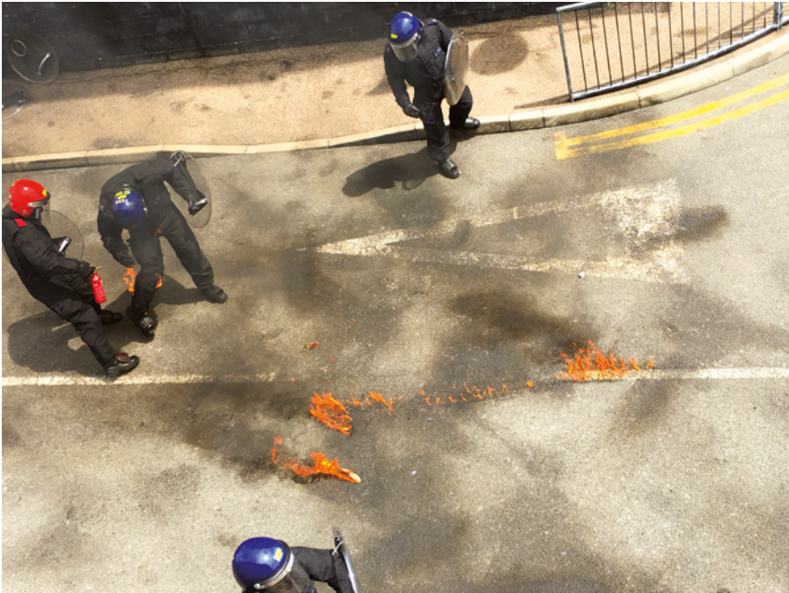
Abb. 36: Ein Kommandeur im englischen MPSTC löscht einen PC, Gravesend

erzählt: »In a training, you know you are gonna be safe, but . compared to the real life . it's not training, you don't know who these people are, you don't know ... they're not here to protect you, they're not here to look after you and anything could happen to you.« (IEG15, Z. 232–236) Trainer F. Denoyer formuliert die Konsequenzlosigkeit für den französischen Kontext, indem er sie in Begriffen des Spiels fasst, bei dem es letztlich nur ums Gewinnen oder Verlieren gehe: »On, ben, on joue [...] je pense que si l'instructeur dit, euh, jouer c'est parce il y a pas de, il n'y aura pas de conséquence réelle si l'exercice se déroule mal, et si, ben, l'unité commet des erreur: on aura joué, on aura perdu.« [»Wir, nun ja, wir spielen [...] ich denke, wenn der Ausbilder sagt, äh, spielen, dann deshalb, weil es keine, es wird keine wirkliche Konsequenz haben, wenn die Übung schlecht läuft, und wenn, nun ja, die Einheit Fehler macht: Wir haben gespielt, wir haben verloren.«] (IFE4, Z. 583–586) Das Scheitern an den Anforderungen hat lediglich negative Effekte auf die professionelle Reputation: Die Trainings bieten den Teilnehmenden die Chance zu demonstrieren, dass sie die Anforderungen bewältigen können, ohne sich selbst oder die Gruppe in Schwierigkeiten zu bringen. Umgekehrt gilt,