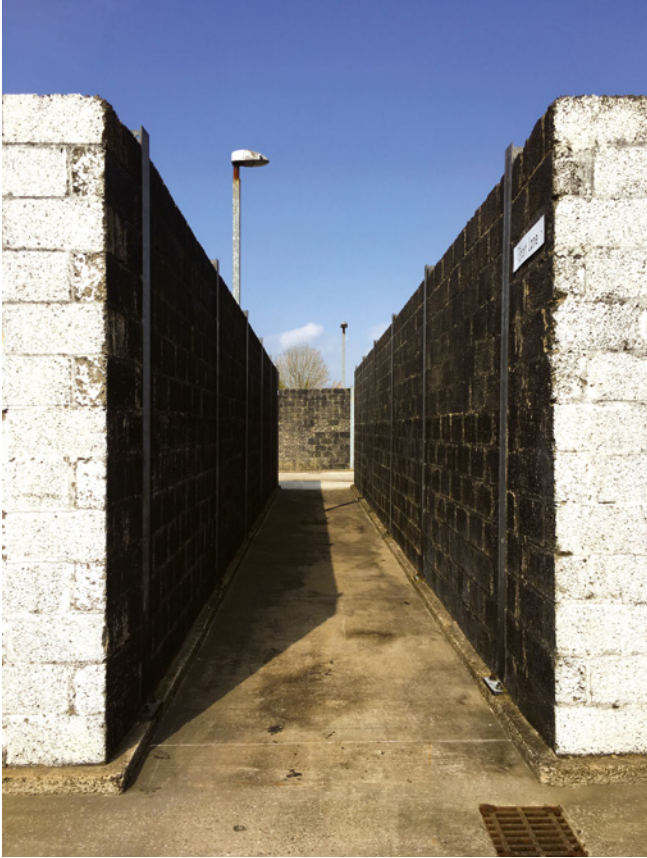
Abb. 19: Lane im nordirischen Public Order Tactical Village nahe Belfast

Aufstände zu polizieren sind, in den innerstädtischen Lagen demonstriert wird, wie man mir erzählt. Der Umstand, dass die englischen Polizeien bis zum Jahr 2004 definitionsgemäß ausschließlich riots probten, wie sie in den ärmeren Quartieren vorkamen, dürfte mit der architektonischen Gestalt in Zusammenhang stehen.