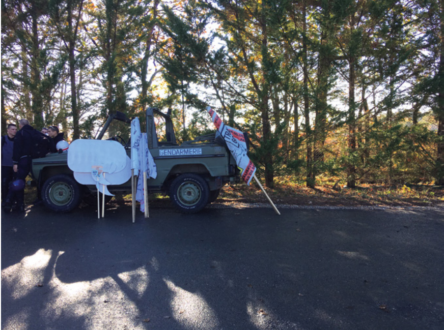
Abb. 27: Plakate und Transparente der Demonstrierenden bei der Gendarmerie nationale, Saint-Astier

zungen zwischen Demonstrierenden und Polizei wird in Frankreich darüber hinaus ein Soundteppich mit ebensolchen Geräuschen eingespielt. Hierzu dienen auf dem gesamten Gelände angebrachte Lautsprecher.