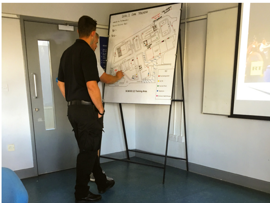
Abb. 32: Trainer vor der für die Briefings genutzten Schautafel der polizeilichen Stadt im MPSTC, Gravesend

disguise their identity, they're just part of the demonstration. So, please be aware of that. [...] If we have any sitdown protests, we will encourage them to move on. [...] Important to prevent the instruction of anyone trying to get into the hunt-club, so if the other demonstration prevents them getting into the hunt-club to pone part of there meeting, please make sure that that is allowed, and deal with any crime as you see fit.« (AudioE10) Immer wieder benennt der Kommandeur die für die polizeilichen Maßnahmen greifenden Rechtsbestände und betont, dass den Einsatzkräften die Rechtsgrundlagen, auf deren Basis sie handeln, genauestens bekannt sein müssten. Er weist die bronze -Kommandeur:innen an, ihre Einsatzkräfte an das Recht auf friedlichen Protest zu erinnern: »We can only use powers when we get to the stage where we need these powers.« (AudioE10)